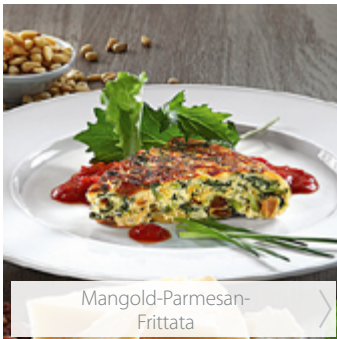
Mangold-Parmesan- Frittata >