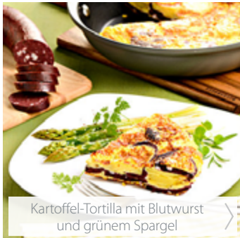
Kartoffel-Tortilla mit Blutwurst und grünem Spargel >