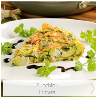
Zucchini- Frittata >