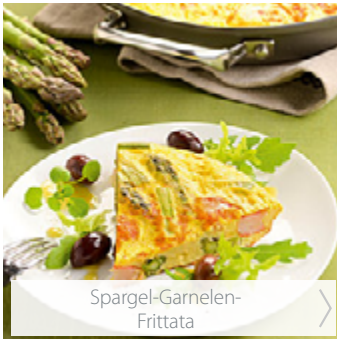
Spargel-Garnelen- Frittata >