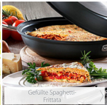
Gefüllte Spaghetti- Frittata >

Noch mehr Rezeptideen finden Sie auf hagengrote.de >