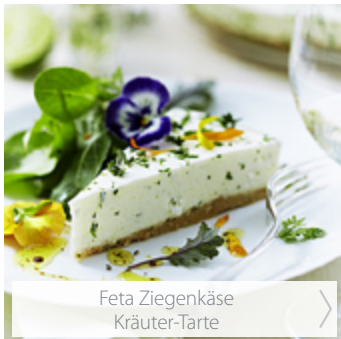
Feta Ziegenkäse Kräuter-Tarte >