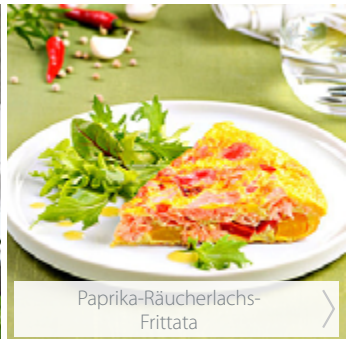
Paprika-Räucherlachs- Frittata >