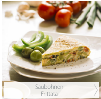
Saubohnen Frittata >