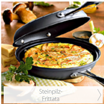
Steinpilz- Frittata >